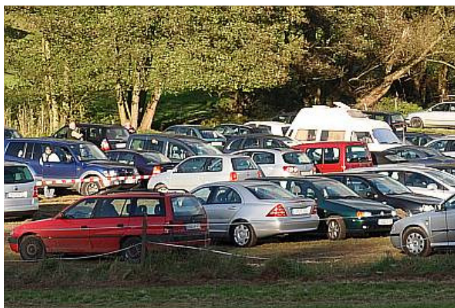
Der Parkplatz war am Sonntag gut gefüllt

Wir hoffen, dass der Annelsbacher Apfel- und Holzmarkt allen Besuchern gefallen hat und bedanken uns ganz besonders bei den Helfern und Organisatoren dieser Veranstaltung. Insbesondere danken wir allen Helferinnen und Helfern, die sich ehrenamtlich bei dieser Veranstaltung engagiert haben. Insbesondere freut uns, dass auch die Annelsbacher Jugend aktiv vertreten war. Weiter so, wir brauchen Euch.