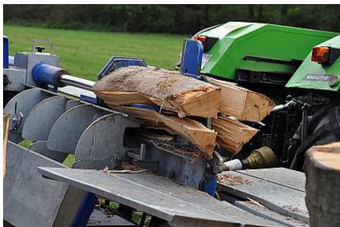
Der horizontale Holzspalter

Die eher gröbere Bearbeitung erfuhr das Holz in Form eines horizontalen Holzspalters, der die dicken Stämme mit Leichtigkeit in vier Teile spaltete. Brennholz bekommt Konkurrenz, Miscanthus als alternativer Energieträger wurde ebenfalls vorgestellt. Das mobile Sägewerk bearbeitete die Holzstämme zu einem anderen Zweck. Interessant anzuschauen, wie der Operateur das Sägewerk bediente und die langen, schweren Baumstämme mit den Bedienhebeln ferngesteuert in die richtige Lage zum Sägen brachte.