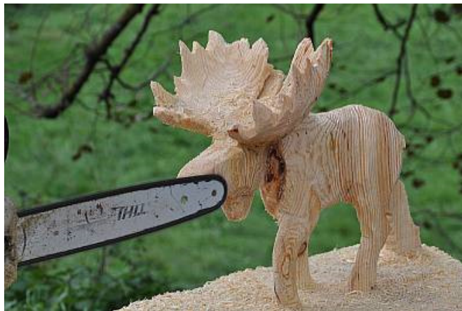
Ein Elch, nur mit der Motorsäge erschaffen

In der "Holzstraße" konnte Holz in all seinen Facetten erlebt werden. Die für die Holzernnte erforderlichen Geräte und Maschinen konnten ebenso betrachtet werden, wie der praktische Umgang mit dem Rohstoff. Kunst war ein wesentlicher Bestandteil, von mit der Motorsäge geschnittenen Figuren über die Schnitzkunst und Drehselei bis hin zur Bildhauerei. Verschiedene Künstler zeigten ihr Können und stellten viele Exponate aus.