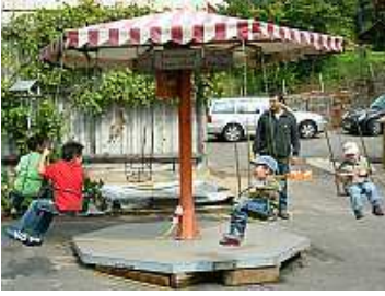
Für die Kleinen war das Karussell trotz des teilweise schlechten Wetters ein Anziehungspunkt

Das Kettenkarussell bot für die Kleinen eine gute Spielmöglichkeit, wenn es auch nach den starken Regenschauern immer mal wieder eine Dusche vom Dach des Kinderkarussells gab, aber das hatten die Kinder schnell verkraftet und machten sich beim nächsten Schauer einen Spaß daraus.