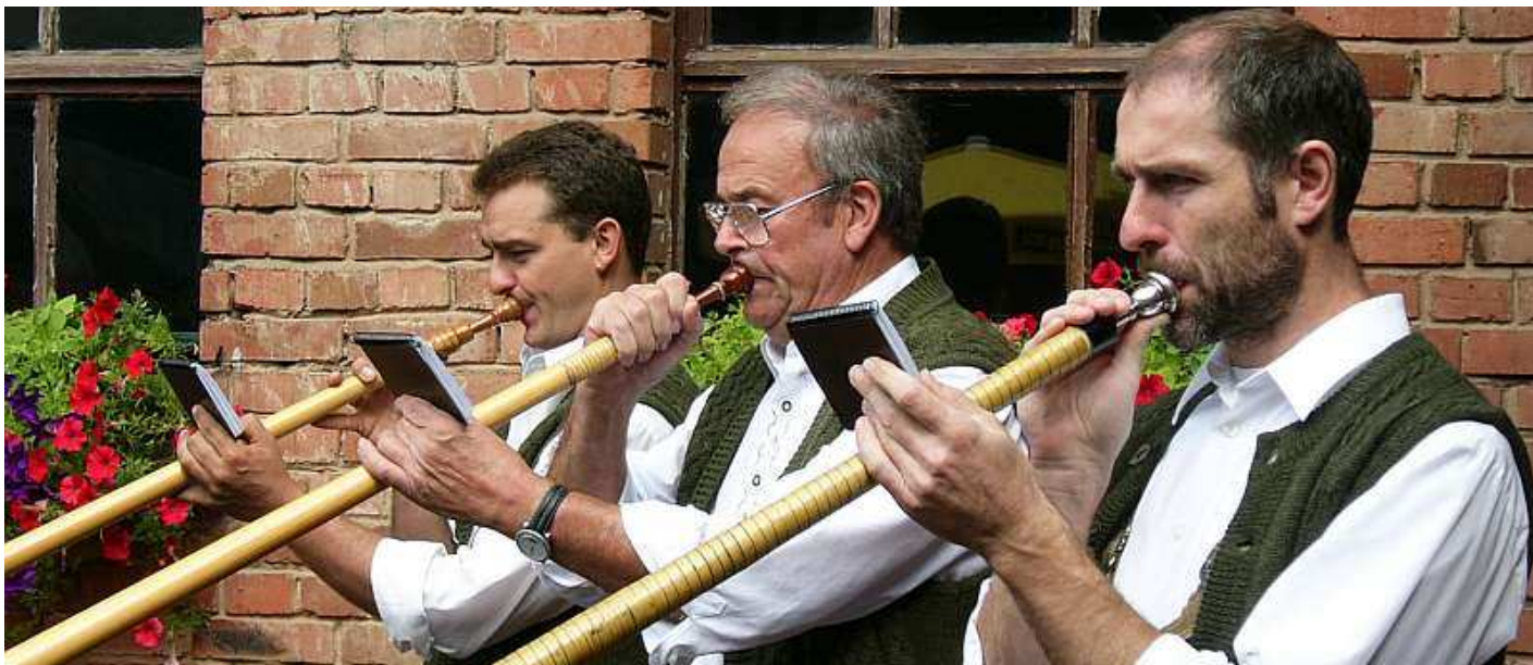
Die Mömlinger Alphornbläser auf dem Annelsbacher Sommerfest 2006 im Königshof

Am 27. August 2006 fanden sich wieder viele Annelsbacher, Freunde und Gäste zum diesjährigen Sommerfest ein.