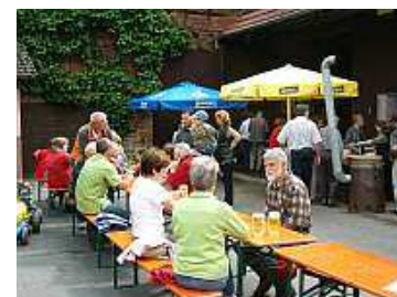
Das Annelsbacher Sommerfest 2006 im Königshof

Wie immer lockten die für das Annelsbacher Sommerfest typischen Speisen, wie frisch gegarte Quellkartoffeln mit Hausmacherwurst oder Quark, sowie die Rindswurst mit Brot. Dazu ein zünftiges Bier vom Fass, oder auch nicht alkoholische Getränke.