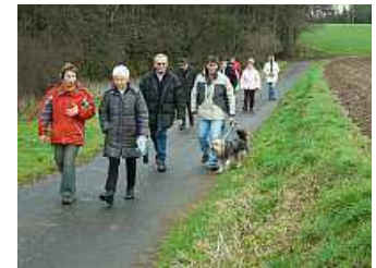
Die Wandergruppe auf der Annelsbacher Höhe

Von hier aus war es dann nur noch ein kurzer Weg bis zum Gasthaus Dornröschen. Dort angekommen nutzten wir noch den herrlichen Sonnenschein um uns der Illusion hinzugeben, dass es jetzt - zumindest dem Wetter nach - auch Frühling hätte sein können.