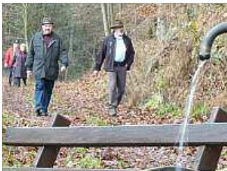
Die Wandergruppe am Brunnen im Rappengrund

Aber unsere Wanderung ging weiter, denn wir nutzten nicht die nächste Möglichkeit, wieder nach Annelsbach hinab zu laufen, sondern zogen weiter, am Annelsbacher Wasserbehälter vorbei bis fast nach Hummetroth.