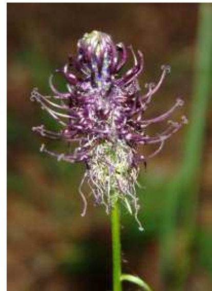
Die schwarze Teufelskralle ( Phyteuma nigrum )