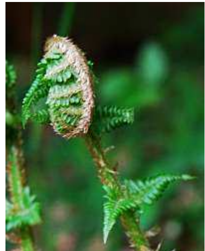
Der echte Wurmfarne ( Dryopteris filix-mas )