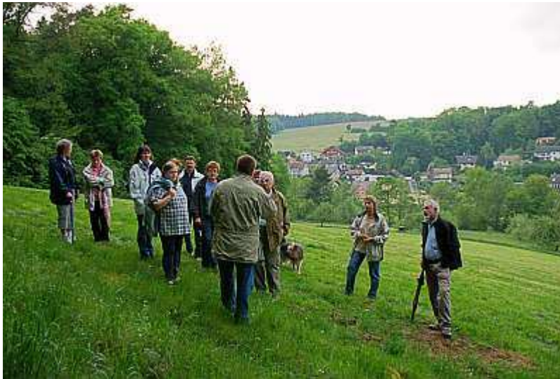
Die Wandergruppe auf der Wiese am Nordhang

Entlang des Wiesenrandes wurden die dort wachsenden Pflanzen erforscht. Die Route ging weiter hinab bis auf den alten Annelsbacher Weg, auf dem wir dann in Richtung Höchst bis zur Abzweigung im Wald wanderten und dort wieder viele Pflanzen am Waldrand unter die Lupe nahmen. Wir konnten zum Beispiel den echten Wurmfarne ( Dryopteris filix-mas ) sehen, der sich zu dieser Zeit gerade