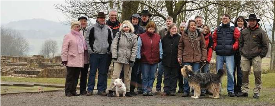
Die Wandergruppe an der Villa Haselburg

Von der Villa Haselburg ging es in einem Bogen weiter über die Felder bis zur Querung der Landesstraße. Gerade hier auf der Höhe spürten wir den kalten Ostwind dieses Wintertages. Danach ging es wieder hinab nach Annelsbach, zunächst am Waldrand, dann durch den Wald entlang des Annelsbachs bis zur Erholungsanlage Annelsbacher Tal.