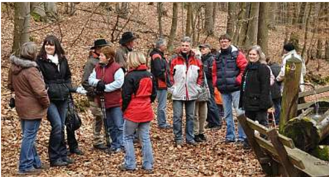
Die Wandergruppe am Brunnen im Rappengrund

Wir wanderten zunächst in westlicher Richtung zur Erholungsanlage Rappengrund, dann in den Wald in Richtung Hummetroth. Auf der Höhe des Brunnens gab es eine kurze Verschnaufpause, bevor es weiter bergauf, vorbei an der Schutzhütte bis nach Hummetroth ging.