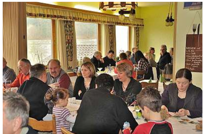
Zum Abschluss gemütliches Beisammensein im Gasthaus Dornröschen

Die vorherige vom Verkehrs- und Verschönerungsverein organisierte Winterwanderung fand im Januar 2007 statt, über die wir auch berichteten. Danach gab es eine längere Pause. Um so schöner, dass wir diesen Brauch jetzt wieder aufgegriffen haben.